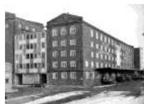
Vejle Dampmølles nyopførte bygning ved Vejle Havn, 1960.