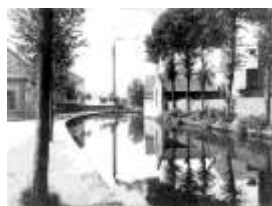
Vejle Dampmølle ved Mølleåen, ca. 1900