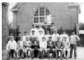
Medarbejdere ved Vejle Dampmølle foran maskinhuset, 1915-18