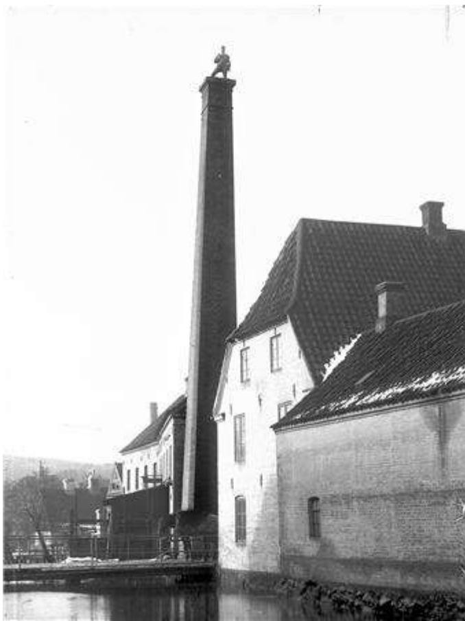
Den gamle del af Vejle Dampmølle på vestsiden af Mølleåen i Møllegade 1906. På den anden side af Mølleåen lå den nye dampmølle.