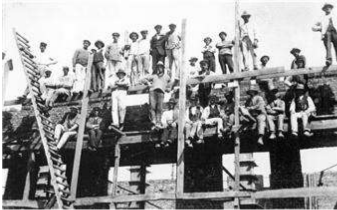
Borgvold 6 under opførelse. Bygningen rummer i dag Vejle Erhvervsudvikling, AOF's Musikskole og Turistbureauet.