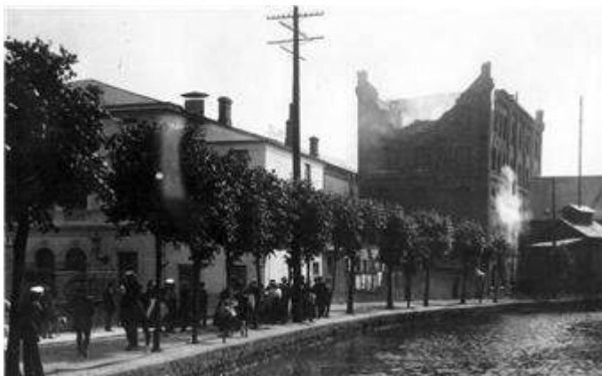
Branden i 1918. Vejleensere er samlet ved Mølleåen for at betragte ruinen af Vejle Dampmølle. Til venstre teatret.

og der er den endnu – dog helt uden damp!